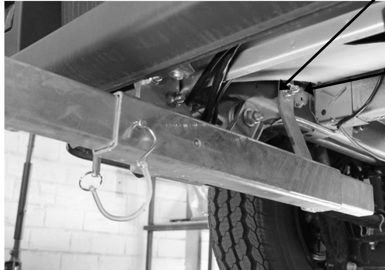
SBA bei vorhandener AHK

Distanzplatten zwischen Chassis Und Lasche, wenn keine AHK vorhanden.